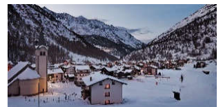
Blick auf Saas Almagell