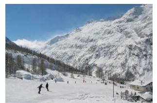
Skigebiet Saas Almagell